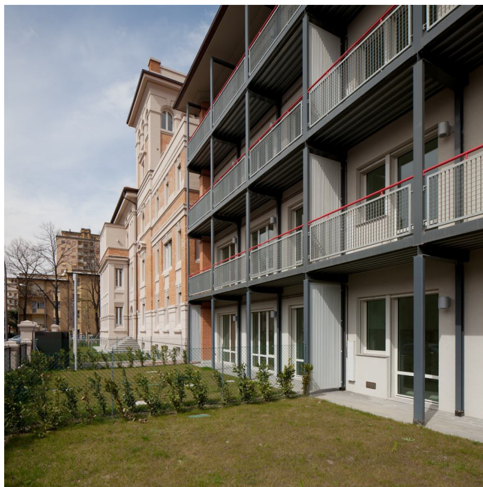
Giardini privati su via Battistini