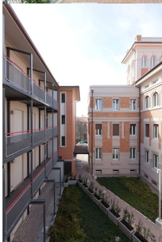
Ingresso Pedonale da via Battistini e Cortile interno