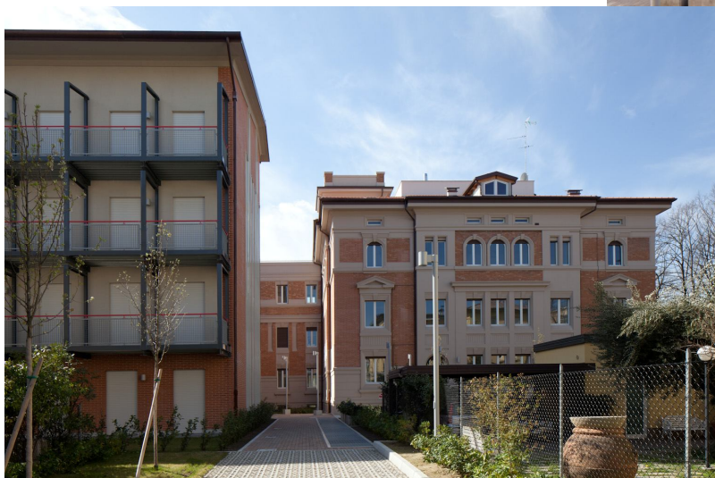
Accesso carrabile/pedonale al cortile interno da via Roma