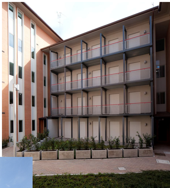
Prospetti interni su cortile