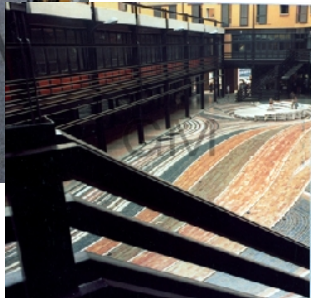
schema colori della piazzetta 2 agosto