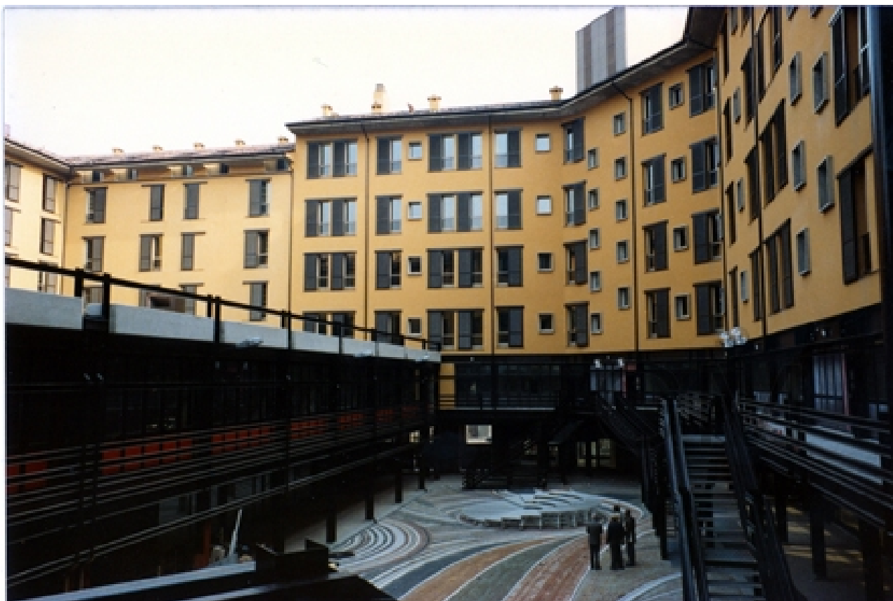
Vista del complesso edilizio e della piazzetta 2 agosto