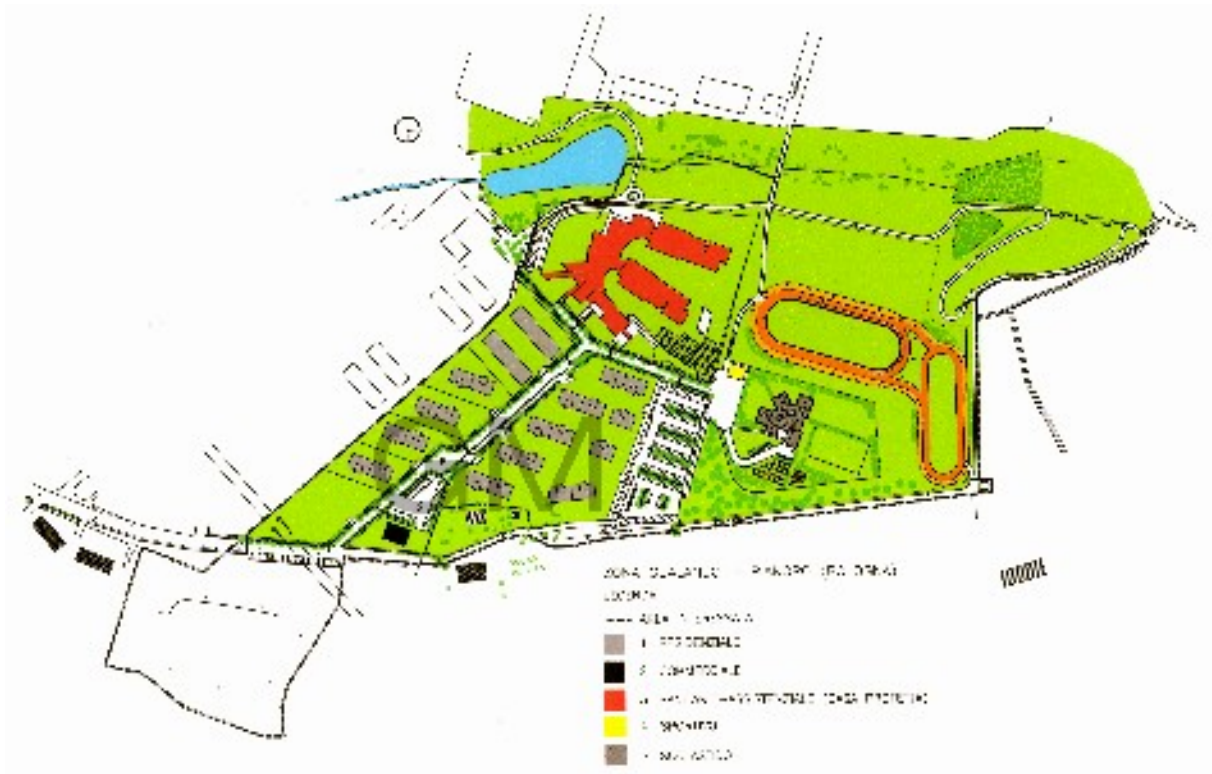
Planimetria generale zona Gualando, Pianoro - Bologna