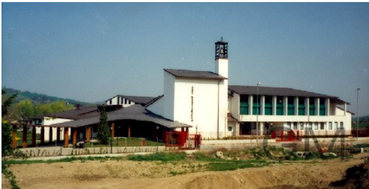
Veduta generale dall'ingresso principale