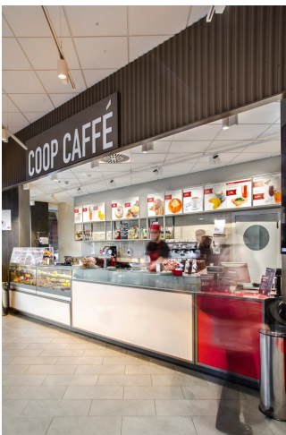
Zona bar. Zona ristorazione – selfservice.