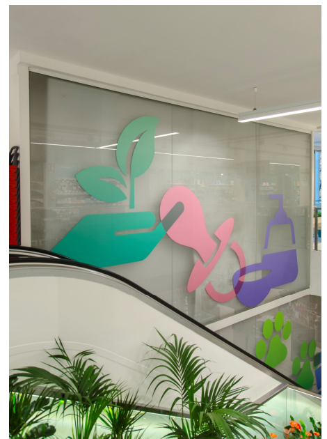
Scale mobili e pannello pubblicitario