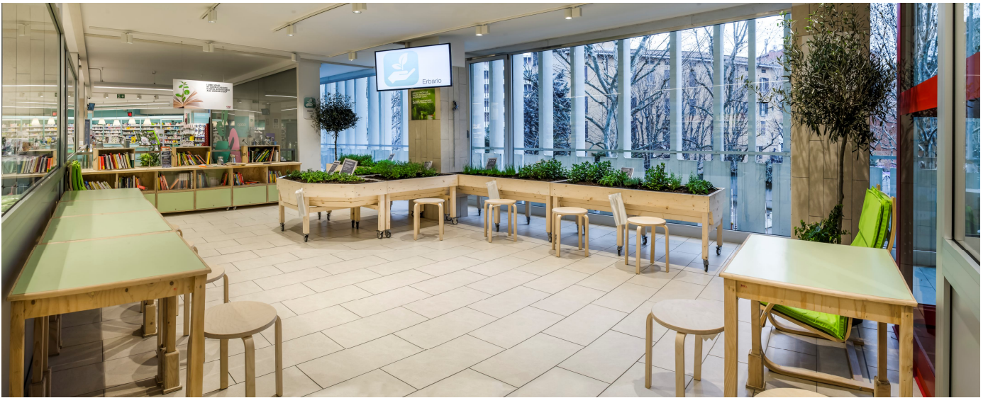
Orto piante aromatiche, biblioteca, zona relax.