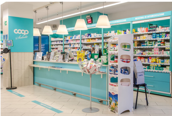
Coop salute, area benessere.