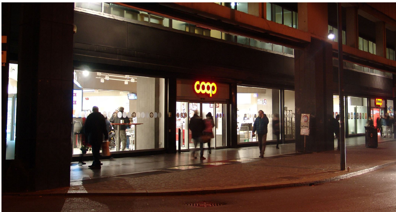
Vista del punto vendita da Piazza dei martiri